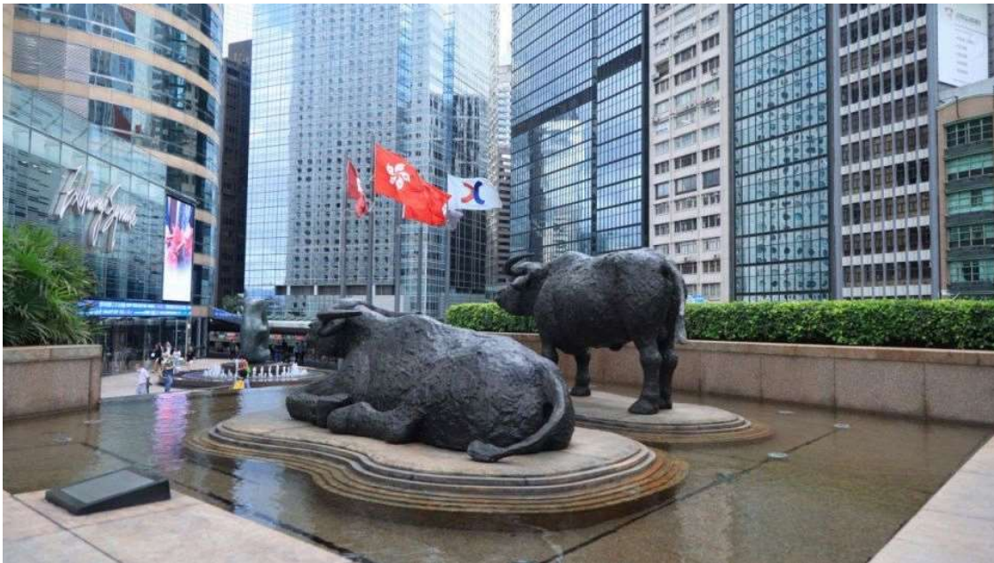
香港必須要提升證券業的環球市場競爭力。資料圖片